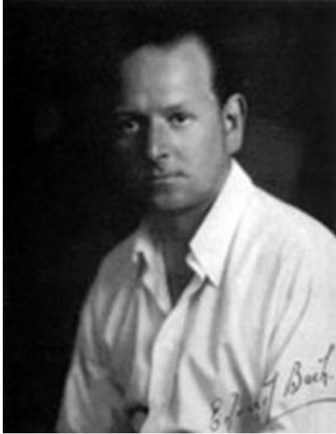
Dr. Edward Bach

(Moseley [Birmingham] 1886 – Sotwell 1936)