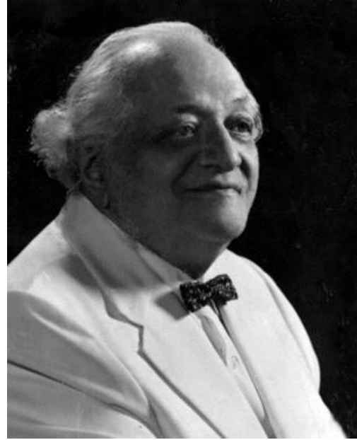
Jacob Levi Moreno

“Toda enfermedad, no es más que la manifestación física de un malestar, de un trastorno debido a una condición mental que altera el equilibrio del cuerpo”.