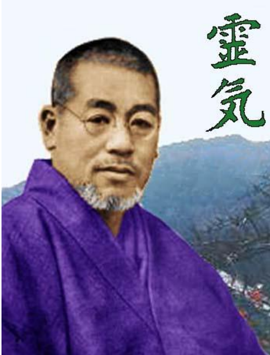
Sensei Mikao Usui