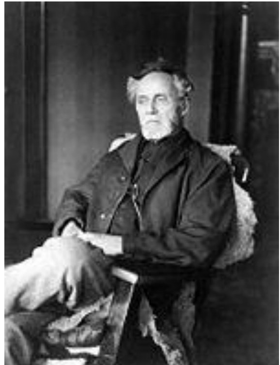
Andrew Taylor Still

“Al restaurar la movilidad de los huesos del cráneo, de la columna vertebral y de la pelvis, también se eliminan las restricciones anormales del sistema, y de esta forma, se estimula el movimiento de los fluidos del sistema nervioso central y de las estructuras que tienen relación con ellas.”